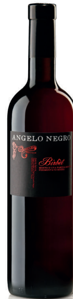
MOSTO PARZIALMENTE FERMENTATO BIRBÈT