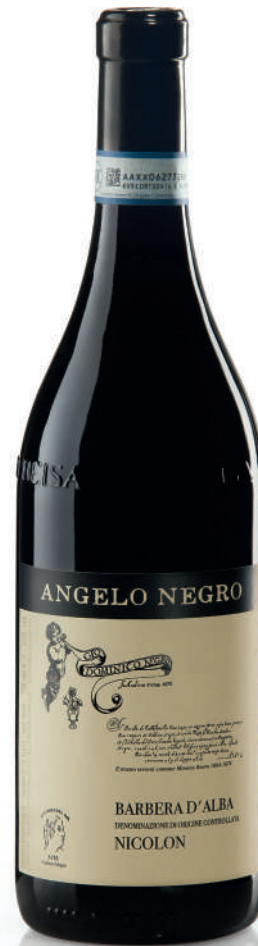
BARBERA D'ALBA DOC NICOLON