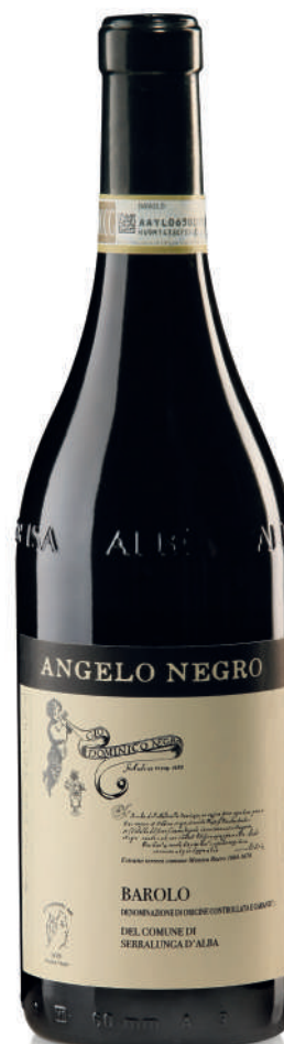
BAROLO DOCG DEL COMUNE DI SERRALUNGA D'ALBA 38 mesi tra botte e bottiglia 38 months between barrel and bottle