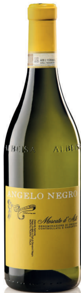
MOSCATO D'ASTI DOCG