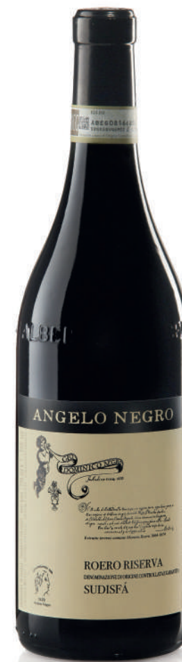
ROERO DOCG RISERVA SUDISFÀ 32 mesi tra botte e bottiglia 32 months between barrel and bottle