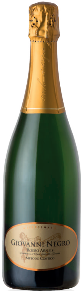
ROERO ARNEIS DOCG DOSAGE ZERO