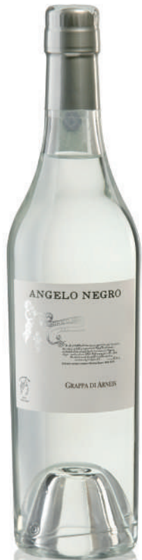
GRAPPA DI ARNEIS