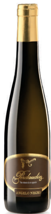
VINO OTTENUTO DA UVE APPASSITE PERDAUDIN