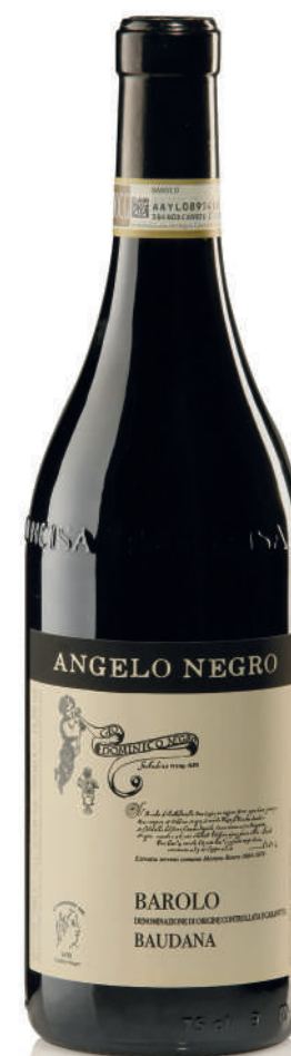
BAROLO DOCG BAUDANA 38 mesi tra botte e bottiglia 38 months between barrel and bottle