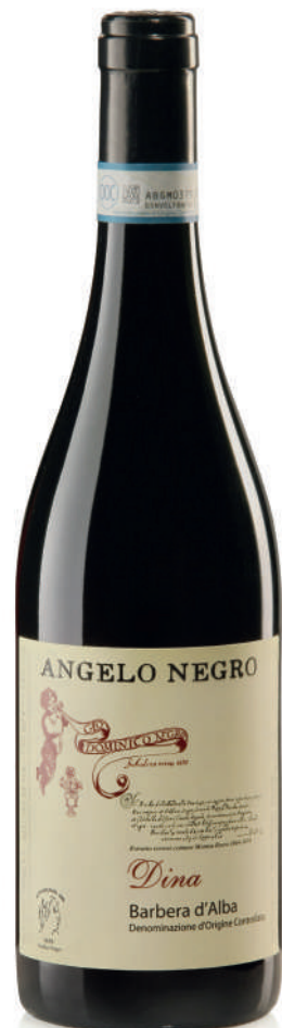
BARBERA D'ALBA DOC DINA