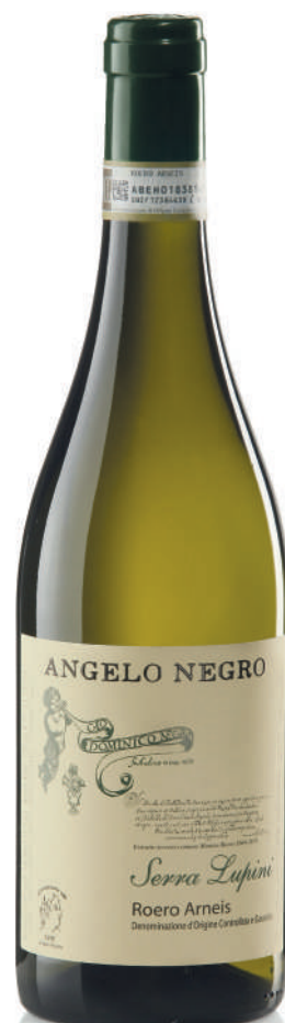
ROERO ARNEIS DOCG SERRA LUPINI