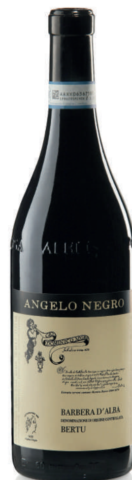
BARBERA D'ALBA DOC BERTU