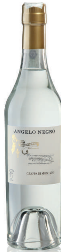
GRAPPA DI MOSCATO