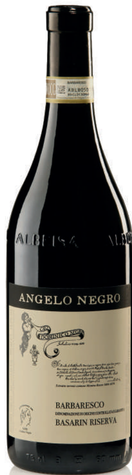
BARBARESCO DOCG BASARIN 26 mesi tra botte e bottiglia 26 months between barrel and bottle