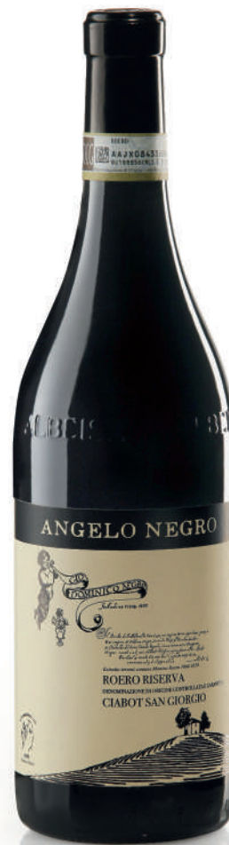
ROERO DOCG RISERVA CIABOT SAN GIORGIO 32 mesi tra botte e bottiglia 32 months between barrel and bottle