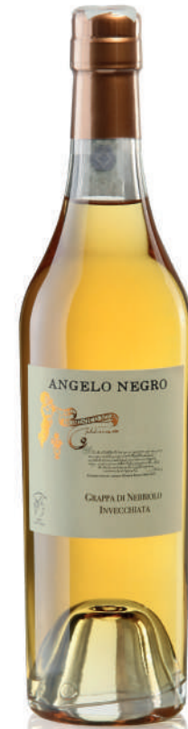
GRAPPA DI NEBBIOLO