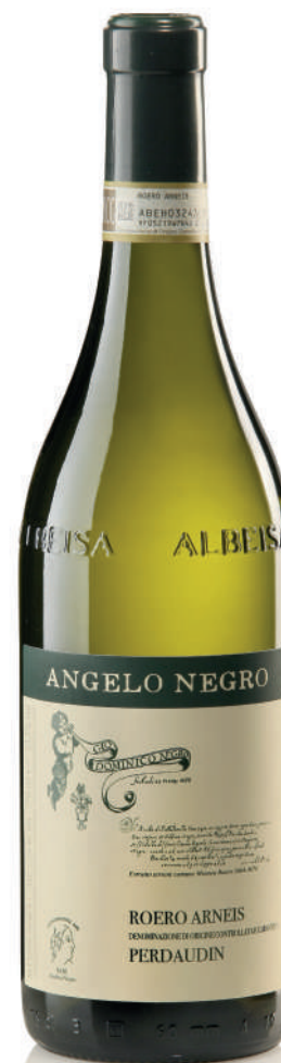
ROERO ARNEIS DOCG PERDAUDIN