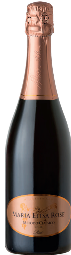
VSQ ROSÉ NEBBIOLO BRUT