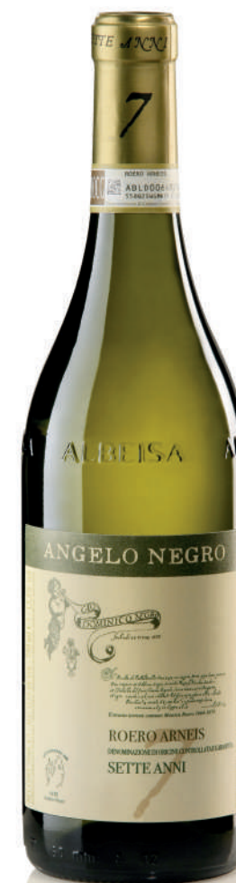
ROERO ARNEIS DOCG SETTE ANNI