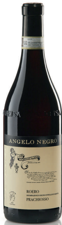
ROERO DOCG PRACHIOSO 20 mesi tra botte e bottiglia 20 months between barrel and bottle