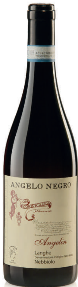
LANGHE DOC NEBBIOLO ANGELIN